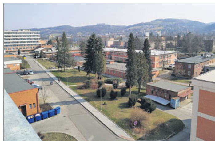
Pohled do pavilonového areálu zlínské nemocnice a okolní krajiny ze 4. patra novorozeneckého oddělení. Nově vybudované moderní onkologické centrum v areálu současné KNTB.

Baťa a jeho architekt dokázali citlivě a urbanisticky vnímat organismus města, které rozvíjeli podobně, jako se vyvíjí tělo. Město vyrůstalo z jejich srdce. Pro nemocnici je důležitá čistota vzduchu, klid. Pokud bychom se drželi porovnání s lidským tělem, měla by být v blízkosti plic a srdce, odvěkého sídla moudrosti. Baťa a jeho architekt František Gahura věděli, že ticho léčí. Proto má být nemocnice, umístěna v zóně klidové, kde nejsou provozy, průmysl, obchody a veškerý koncentrovaný dopravní neklid. Nemocnice v Malenovicích mi přijde spíše jako slezina přišitá na hýždí nebo na plosce nohy. Hýždě jsou důležité, bez nich bychom nemohli sedět, bez plosky nohy bychom jen stěžovali chodili. Centrum zdraví a léčby bych opravdu umístil jinde. Přesněji bych ho nechal tam kde je, a to i v respektu