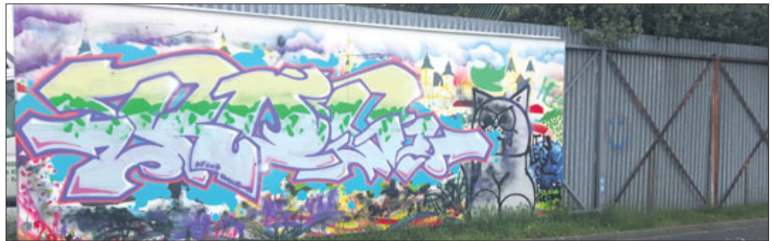
Na horním snímku vidíme původní malbu na první části nové graffiti stěny v Kroměříži. Byla dílem studentů Arcibiskupského gymnázia. Obsahuje řadu reálií z historie města.