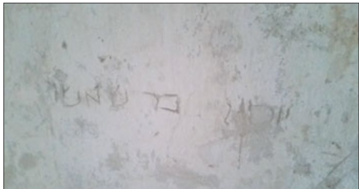
Nově nalezený hebrejský nápis na kurovickém hradu je z roku 1656 a podle expertů jej psalo dítě.