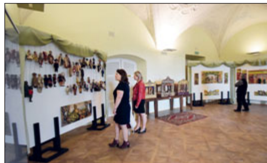
Foto z výstavy loutek v holešovském zámku.

Výstava Loutky a loutková divadla rekapituluje vývoj českého loutkářství