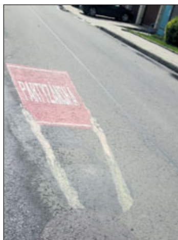
Malba neznámého umělce na silnici v Hulíně už vlivem počasí bledne.